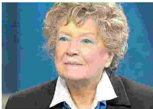
La scrittrice Dacia Maraini, presidente della Giuria del Premio