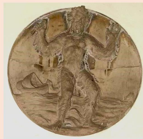
in foto il bassorilievo che ritrae Colapesce

L'iniziativa speciale, in collaborazione con Casa del Contemporaneo/Le Nuvole , prevede l'apertura della sede dell'Istituto con due gruppi di visita, guidati da storici dell'arte per illustrare la storia e le caratteristiche del maestoso Palazzo Filomarino e un percorso interno alla sede dell'istituto e alla sua raccolta di volumi illustrato dalle esperte bibliotecarie. Al termine delle due visite i partecipanti si accomoderanno nelle sale di rappresentanza dove, dopo il saluto del segretario generale e una breve introduzione storico-letteraria del professore Nunzio Ruggiero, si terrà la lettura delle pagine tratte da Storie e leggende napoletane dell'attore e regista Andrea Renzi , in questi giorni (fino a domenica 19) al Teatro San Ferdinando per Cinemamuto, uno spettacolo diretto da Gianfranco Pannone sul tema della censura in epoca fascista, ispirato alla storia della regista Elvira Notari.